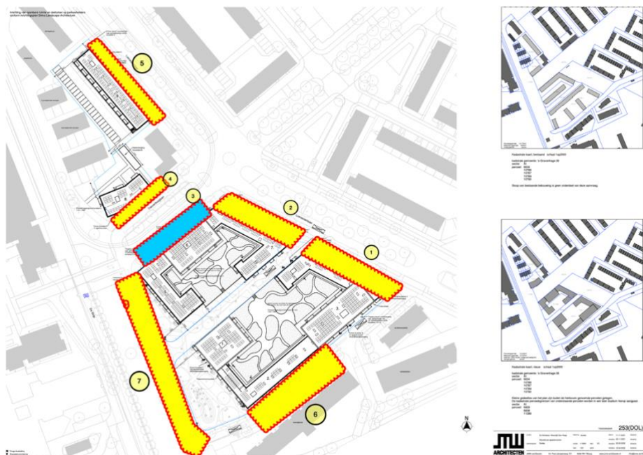
Afbeelding 2: veiligheidszones en afzettingen rondom het project De Schaloen

De aannemer geeft aan dat zij bij bouwdeel C nog aan het puzzelen zijn voor wat betreft de bouwveiligheid.